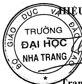
Trang Sĩ Trung